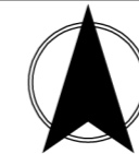
Чертеж: Ситуационен план на улично осветление