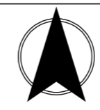
Чертеж: Ситуационен план на топлофикация